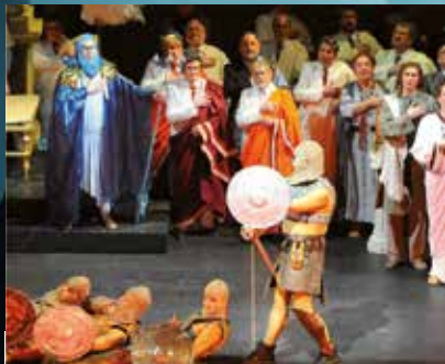
2013 »Vivat Colonia«