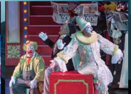
2017 »Circus Colonia«

»Umjubelte Aufführungen« oder »Ausverkauft – nur noch Restkarten erhältlich«, titeln Kölner Medien in den letzten Jahren häufiger über die Bühnenspielgemeinschaft »Cäcilia Wolkenburg«. Die »bunte Tochter« des Kölner Männer-Ge-