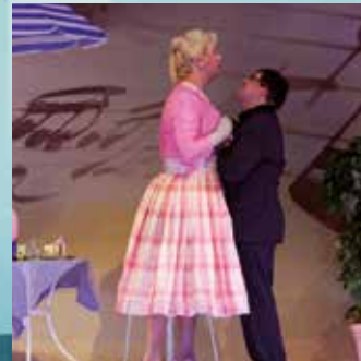
2015 »Diva Colonia«