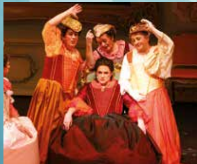
2014 »Dä Schinghillige«