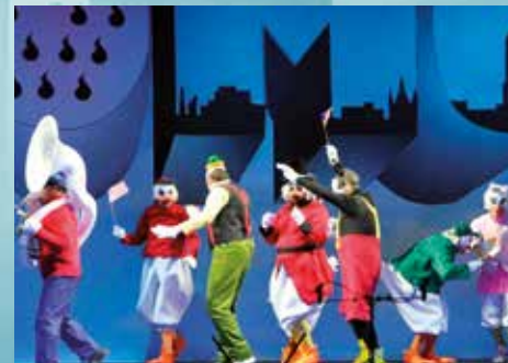
2016 »Janz schön jeheim«